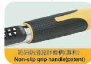
防滑防燙設計握柄(專利) Non-slip grip handle(patent)