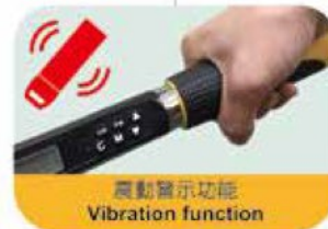
震動警示功能 Vibration function