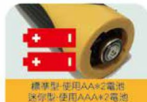
標準型-使用AA*2電池 迷你型-使用AAA*2電池 Normal-AA*2 batteries Mini-AAA*2 batteries