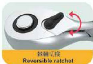
棘輪切換 Reversible ratchet