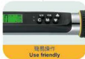
簡易操作 Use friendly