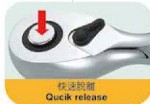
快速脫離 Quick release