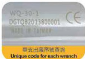
單支出廠序號查詢 Unique code for each wrench